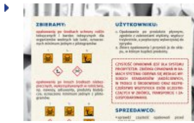
Opakowania po środkach ochrony roślin - plakat

Źródło: Polskie Stowarzyszenie Ochrony Roślin ul. Trębacka 4, 00-074 Warszawa, Pismo z dnia 25.01.2017 r. dotyczące opakowań po środkach ochrony roślin, Warszawa 2017 r.