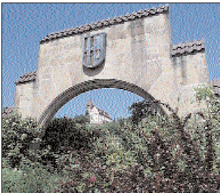
Jeden z zabytków