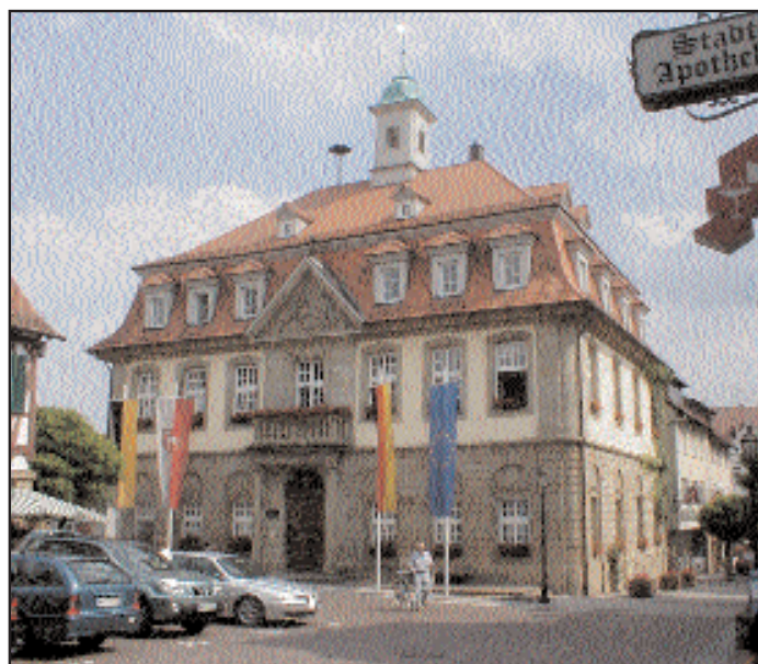
Budynek Urzędu Miasta

na, rozbudowanym w XV wieku, Hausen wzdłuż rzeki Zaber, gdzie został odnaleziony olbrzymi rzymski Filar Jowisza (II-III w. n. e.). Dürrenzimmern słynie